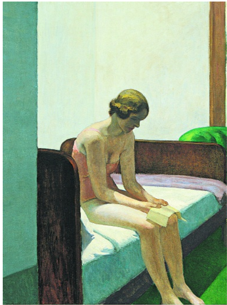
EDWARD HOPPER. HABITACIÓN DE HOTEL, 1931 (DETALLE). MUSEO THYSSEN-BORNEMISZA, MADRID

La Comunidad de Madrid se ha comprometido también a hacer inversiones por valor de 613 millones de euros durante el tiempo que dure el convenio.