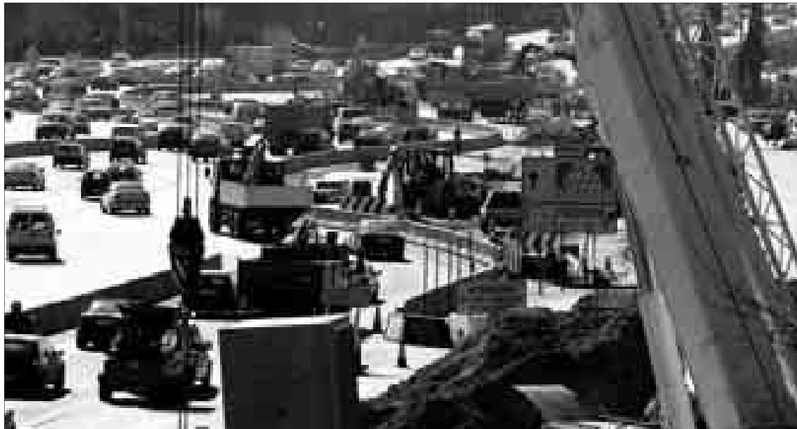
Los desvíos por las obras están provocando atascos en numerosos puntos de la M-30.

El daño colateral de esta conquista son los atascos, los despistes que sufren los conductores con los cambios en el firme y unas vistas de lo más articuladas. Cada mañana, en los puntos de entrada a la capital más afectados (como el nudo de la carretera de Valencia o el de la carretera de Burgos) se sufren atascos importantes por la ocupación de las máquinas de parte de los carriles. Y por la tarde, la imagen de peregrinación tranquila de los vehículos se repite entre grúas que suben y bajan y obreros cambiando los carteles informativos