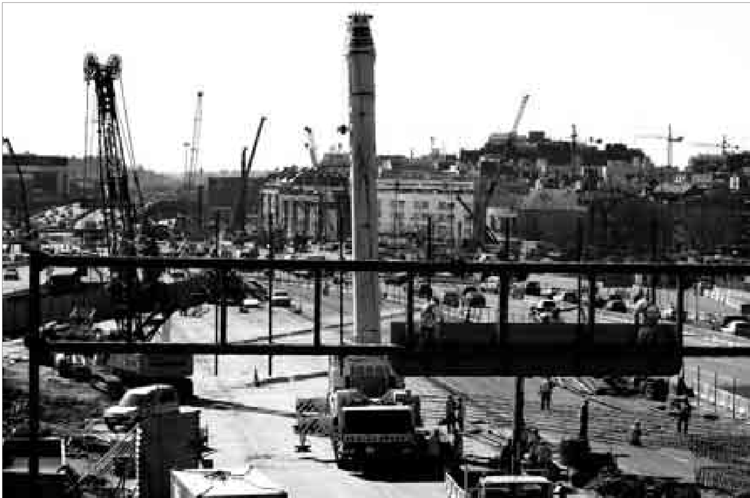
Dos operarios desmontan uno de los carteles informativos de la M-30, por la ocupación de esos dos carriles por las obras de reforma.

Obras. Los trabajos en la circunvalación han convertido algunas zonas de la capital en una exposición de maquinaria y en una gincana para los conductores con ocupación de carriles, cambios de sentido, salidas provisionales o curvas sorpresa