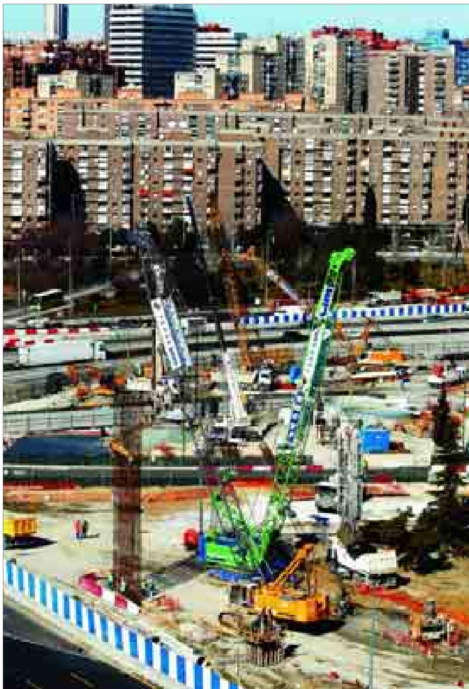
Una excavadora trabaja en las obras de la M-30, en la zona norte de la capital.