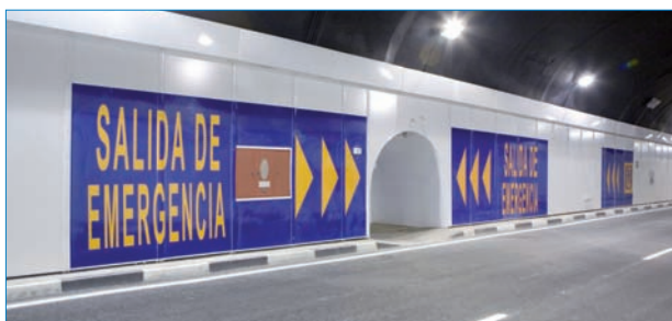
Sistemas de seguridad instalados en el túnel.