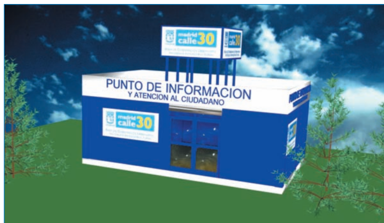
Punto de información.