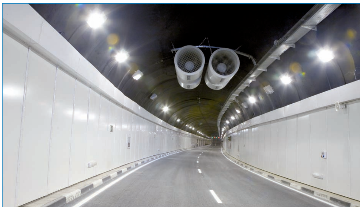
Interior de los túneles.