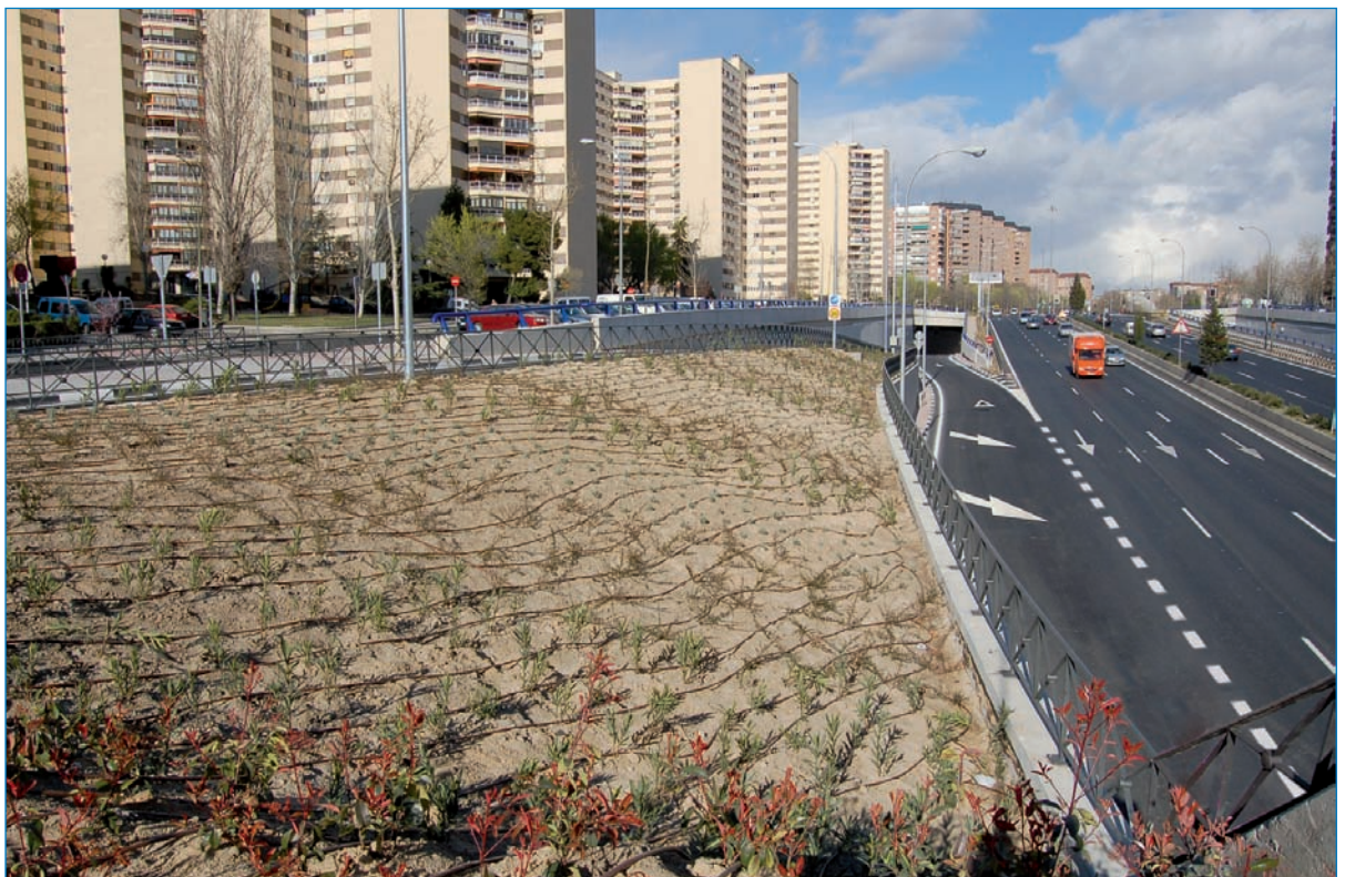
Incorporación a la avenida de la Ilustración desde el túnel.