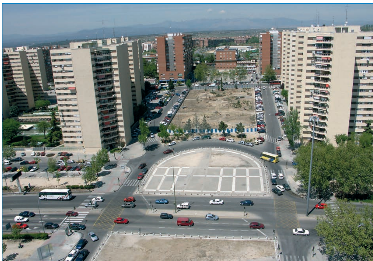
Vista de la avenida de Betanzos antes de su remodelación.

Estas calles eran utilizadas como itinerarios alternativos para desplazarse desde la avenida de la Ilustración hasta Ventisquero de la Condesa.