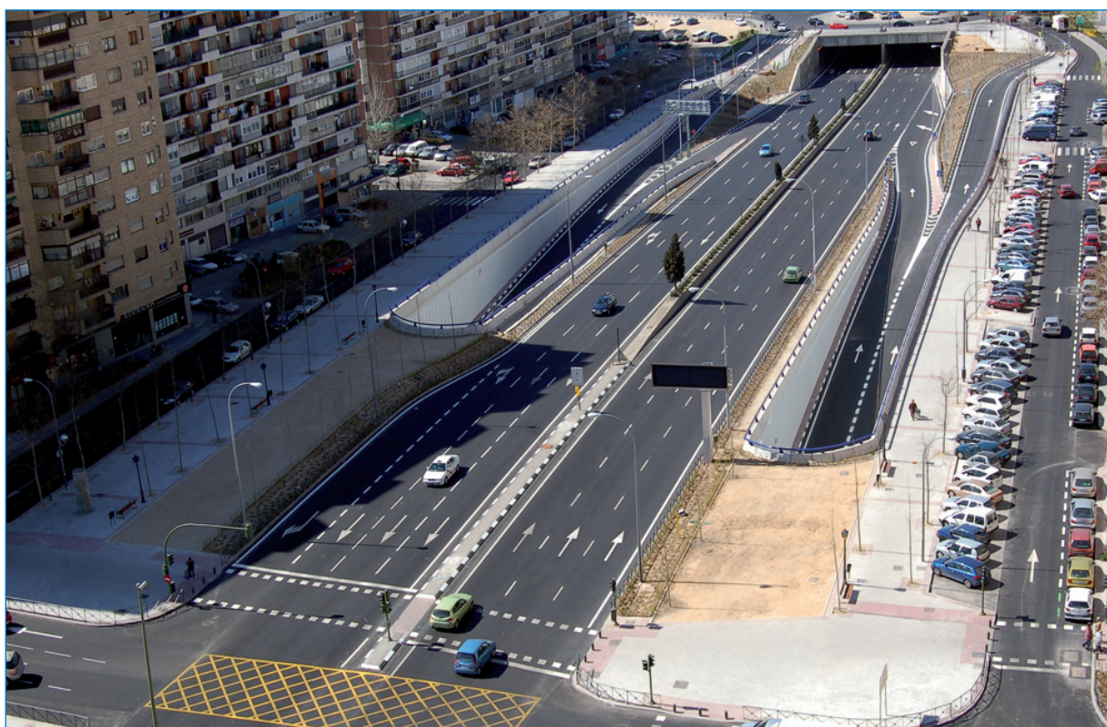
A la derecha, salida a la avenida de la Ilustración desde el túnel. A la izquierda, entrada al subterráneo dirección Ventisquero de la Condesa.

Teniendo en cuenta el menor recorrido que deberán efectuar y la mejora de la fluidez de la circulación, los usuarios se ahorrarán cada año más de 350.000 horas de viaje, lo que redundará en una mejora de su calidad de vida.