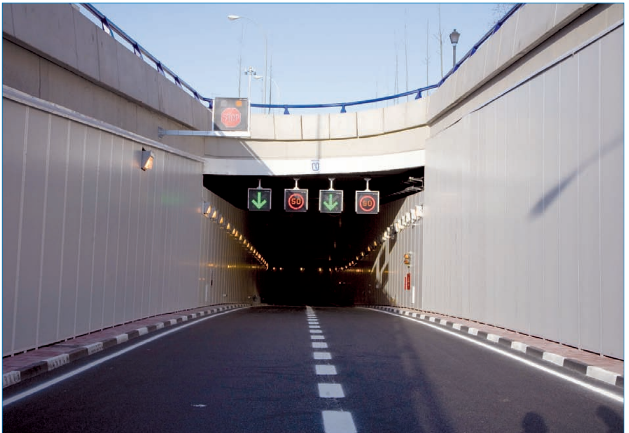
Acceso al túnel desde la avenida de la Ilustración.

Está formado por dos túneles unidireccionales con dos carriles de 3,50 metros de anchura cada uno, cuyo trazado permite realizar todos los movimientos posibles con ambas avenidas, lo que mejora sensiblemente la conectividad.