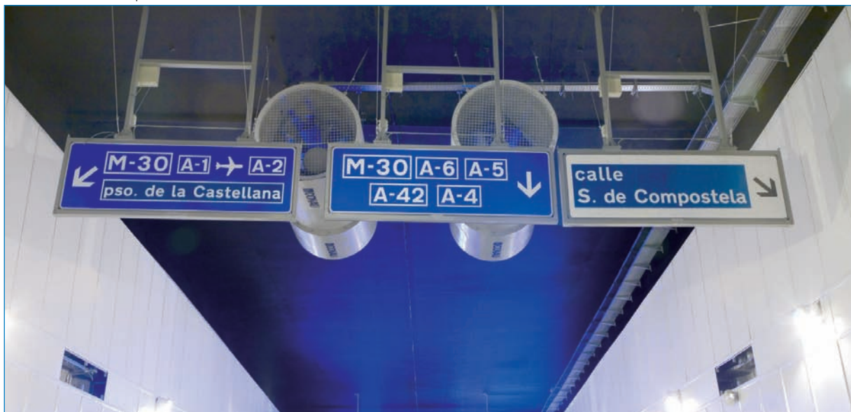
Carteles direccionales en el interior del túnel.