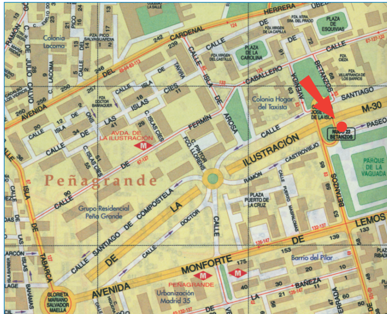
Situación del puesto de información en la avenida de Betanzos esquina con avenida de la Ilustración.

Con motivo de la ejecución del Eje Ventisquero de la Condesa-Avenida de la Ilustración, el Ayuntamiento abrió en abril de 2005 un Punto de Información entre las avenidas de la Ilustración y de Betanzos en el que se han recibido 4.009 visitas, respondido 3.696 consultas y distribuido 6.000 folletos informativos.