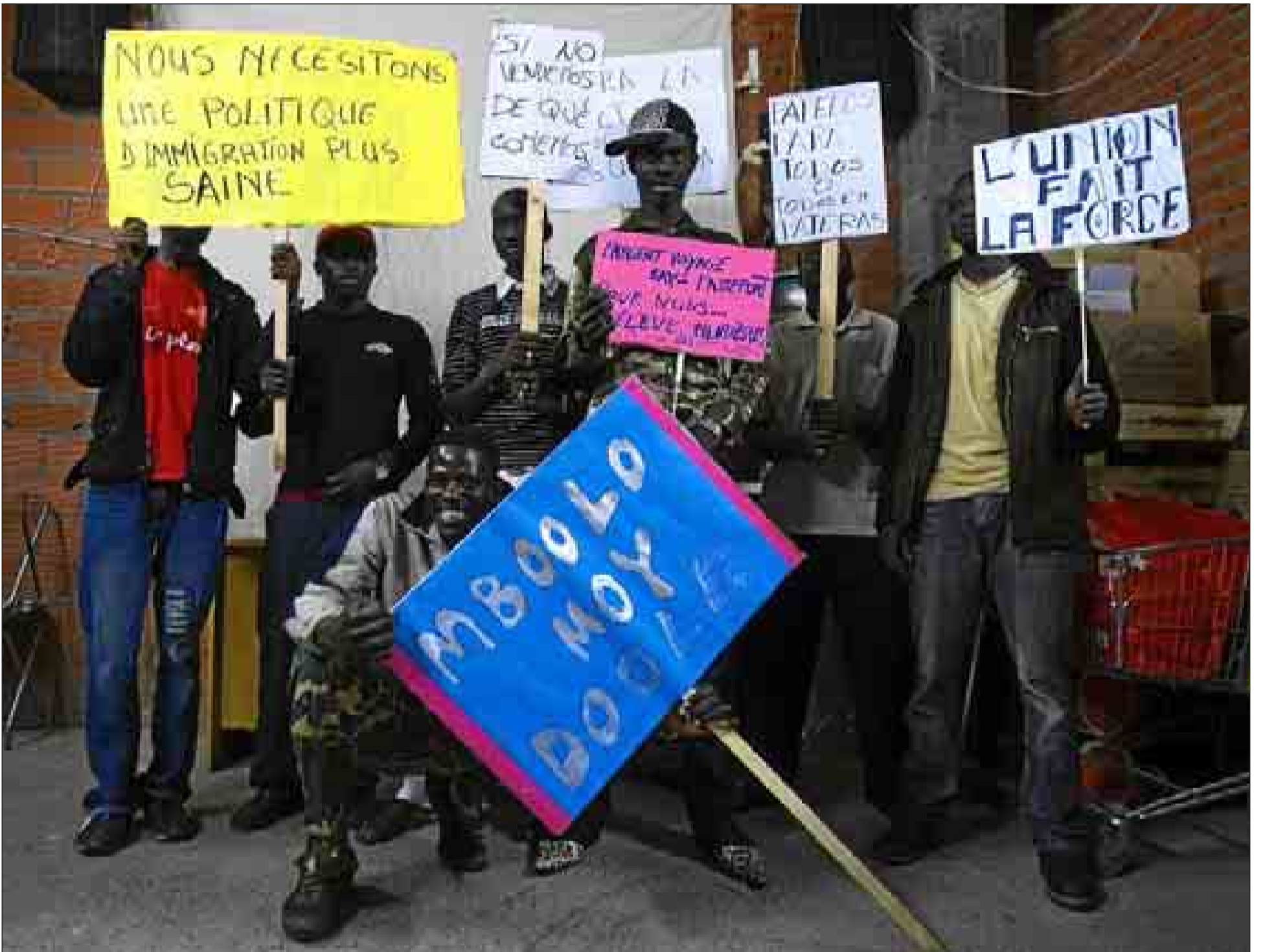
Un grupo de 'manteros', posando ayer con pancartas reivindicativas en varios idiomas para reclamar la despenalización de su actividad.

Cien inmigrantes ilegales se 'asocian' para pedir que se les permita vender en la calle y no ir a la cárcel por su trabajo /10