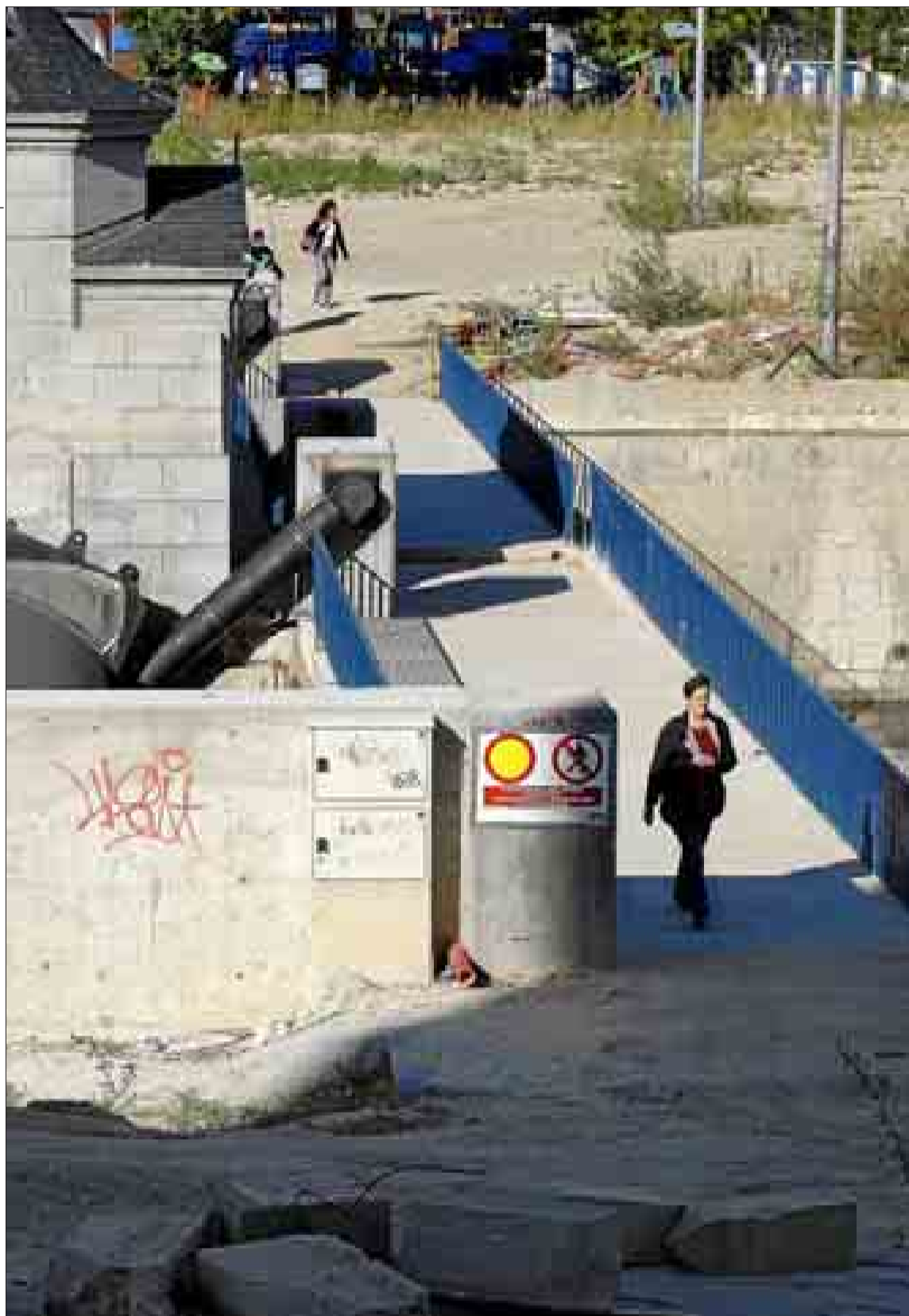
Algunos vecinos del Manzanares cruzan el río por una antigua pasarela. 'Prohibido el paso', se lee en un cartel.

La indignación ante la «lentitud» de las obras es generalizada entre los vecinos. «Yo creo que no ajardinarán la zona hasta las elecciones, para dar un empujón, o cuando vengán los inspectores de los Juegos. No se pueden encontrar la M-30 como hace cuatro años», pronostica Antonio, del primero. Sus ventanas