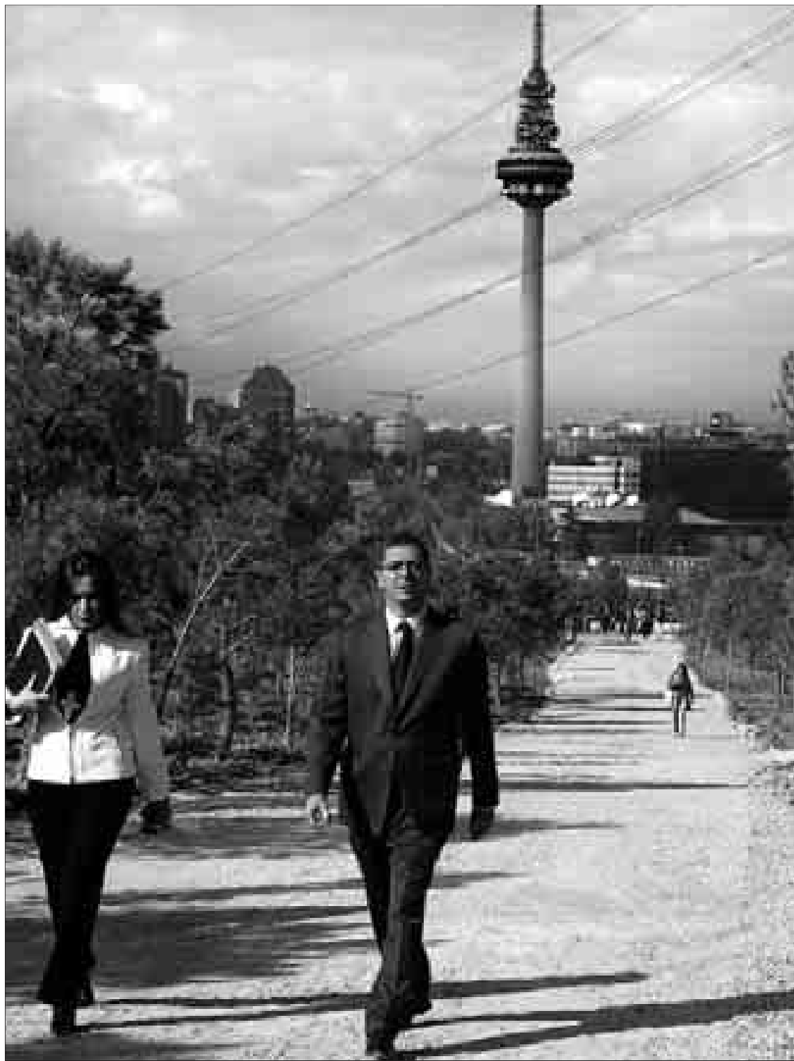
El alcalde, ayer, en el parque de O'Donnell, junto a su directora general de Medios.