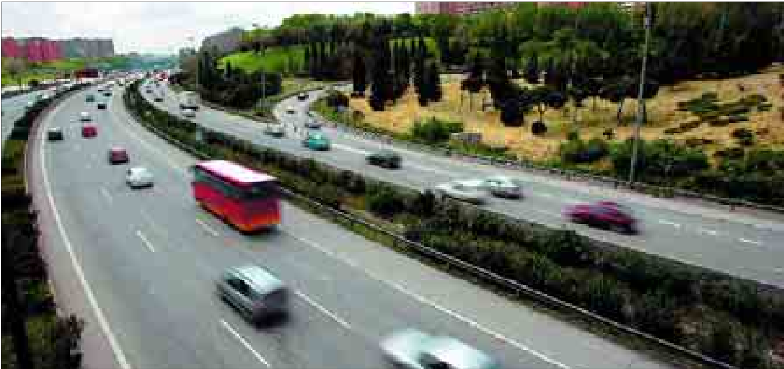
La zona Este de la M-30, en la imagen, puede ser la única que se remodele esta legislatura si no se superan graves trabas.